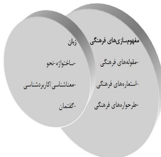
شکل ۲- الگوی تحلیلی زبان‌شناسی فرهنگی (۱۰)

زبان نیز می‌شود. این بازنمایی را در قالب طرحواره‌های فرهنگی، مقوله‌های فرهنگی و استعاره‌های فرهنگی در زبان می‌توان جست. طرحواره‌های فرهنگی جنسیت‌زده‌ای چون پرستاری برای زنان و قضاوت برای مردان از همین دست است بنابراین وقتی می‌گوییم «پرستاری آمد»، گزاره ما تداعی‌کننده یک زن است و وقتی می‌گوییم «قاضی‌ای آمد» تداعی‌کننده یک مرد است. این تخصیص تجویزی مشاغل ناشی از نوعی نگاهی جنسیت‌زده می‌تواند باشد. در استعاره‌های فرهنگی جنسیت‌زده‌ای چون خاله سوسکه و آقا موشه نیز با همین رویه مواجهیم. همچنین