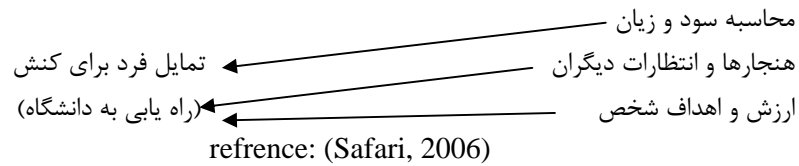
جدول ۱- رابطه بین متغیر و نظریه منتخب