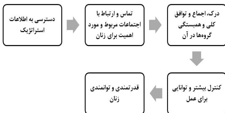
شکل ۱- نقش فاوا در قدرت‌بخشی و توانمندی زنان (Nath, 2001)

در این راستا می‌توان فاوا را یکی از ابزارهای ایجاد عدالت جنسیتی نیز به حساب آورد. فاوا مکانیزم انتقال و ابزار ایجاد ارتباط است و می‌تواند به زنان در فراهم آوردن خدمات، آگاه‌سازی آنان، پایان دادن به انزوای زنان که ریشه در فرهنگ‌ها دارد، کمک کند. به بیان دیگر، با استفاده از فاوا، زنان ضمن حضور فیزیکی در خانه و انجام وظایف خود در قبال خانواده، می‌توانند فعالیت اجتماعی و اقتصادی داشته‌باشند. این امر سبب می‌شود که حتی در جوامعی که از نظر فرهنگی موانعی برای مشارکت زنان در عرصه‌های اجتماعی - اقتصادی وجود دارد، زمینه‌ی حضور آنان فراهم شود (Azizi, 2010). در این رابطه دالی (Daly, 2003) بیان می‌کند که در برخی از جوامع، مشاغلی که فقط مستلزم حضور در مکان‌های مردانه هستند، محدودیت‌هایی را برای زنان به‌وجود آورده‌اند که با پیشرفت فناوری، فاوا این فرصت را برای زنان از طریق تلفن، رایانه و اینترنت فراهم کرده‌است که