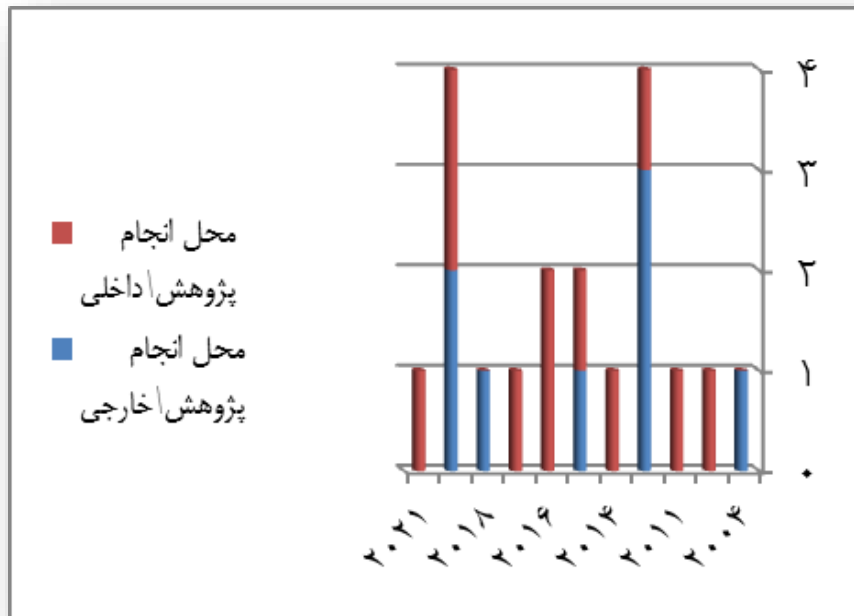
نمودار ۲- مقایسه تعداد پژوهش های داخلی و خارجی در سالهای مورد بررسی