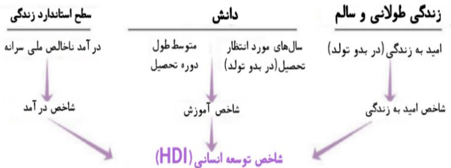
شکل ۲- زیرشاخص‌های شاخص توسعه انسانی

نیز با درآمد ناخالص ملی سرانه (GNI ۱ ) اندازه‌گیری می‌شود (شکل ۲). ارزش عددی شاخص توسعه انسانی و هر یک از اجزای آن بین صفر و یک است. ارزش عددی شاخص توسعه انسانی و هر یک از اجزای آن بین صفر و یک است. هرچه ارزش عددی این شاخص برای یک کشور به یک نزدیک‌تر باشد، آن کشور از سطح توسعه انسانی